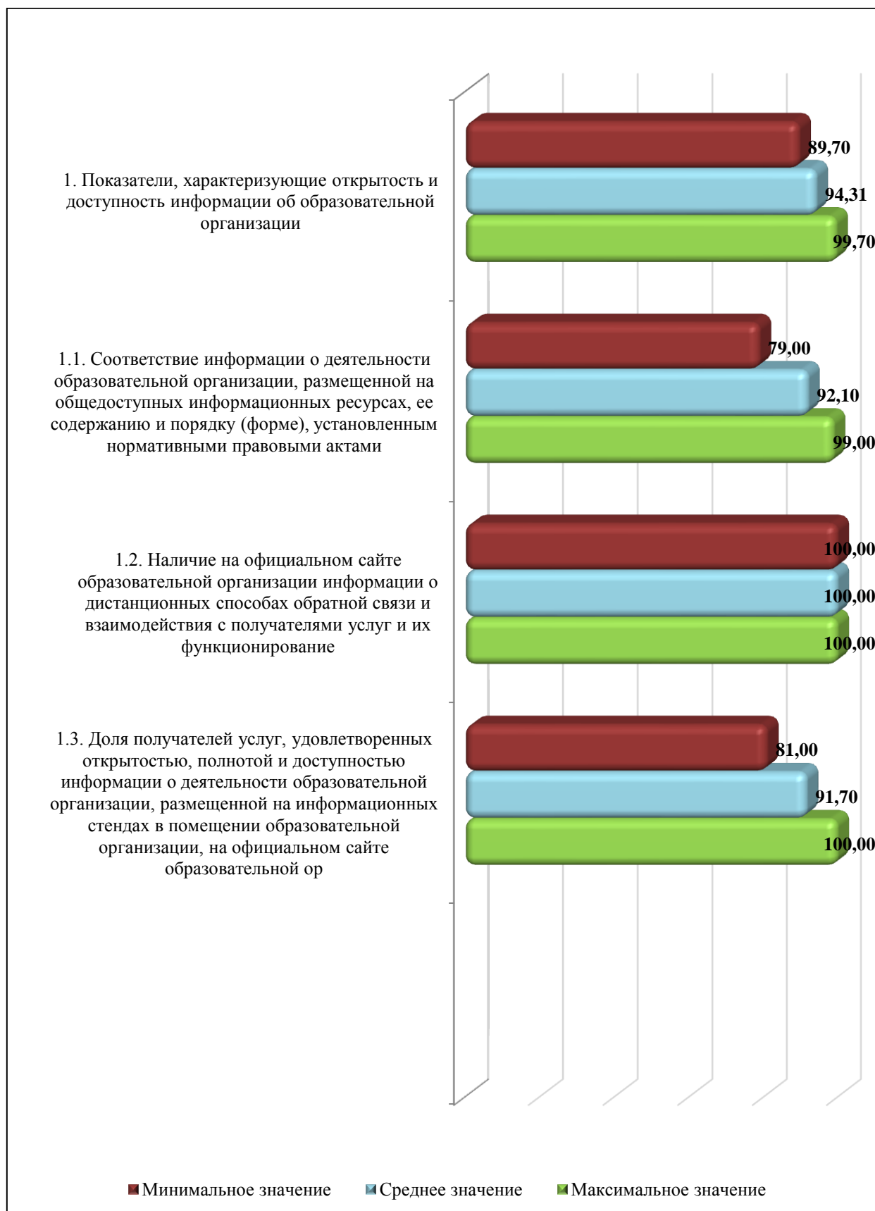
Диаграмма 4.1– Среднее, наибольшее и наименьшее значение показателей группы «Открытость и доступность информации об образовательной организации», в баллах