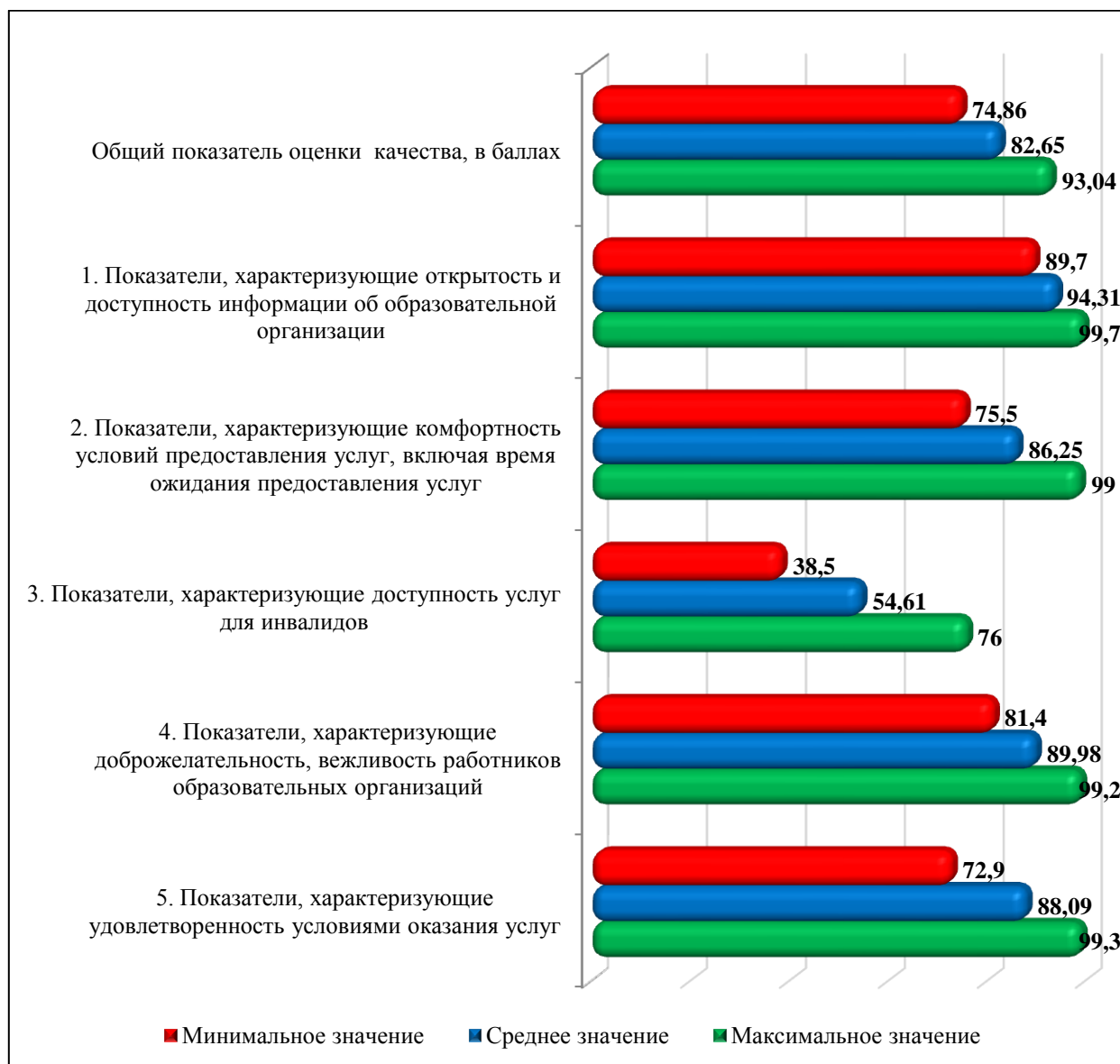
Диаграмма 3.1. Среднее, максимальное и минимальное значения общего показателя оценки качества условий осуществления образовательной деятельности образовательными учреждениями в разрезе отдельных разделов, в баллах.

Наиболее приближено к максимальным 100 баллам среднее значение 1 группы показателей «Открытость и доступность информации об образовательной организации» - 94,31 балла. Среднее значение группы показателей «Доступность услуг для инвалидов» является минимальным среди всех 5 разделов оценки (54,61 балла из 100 возможных).