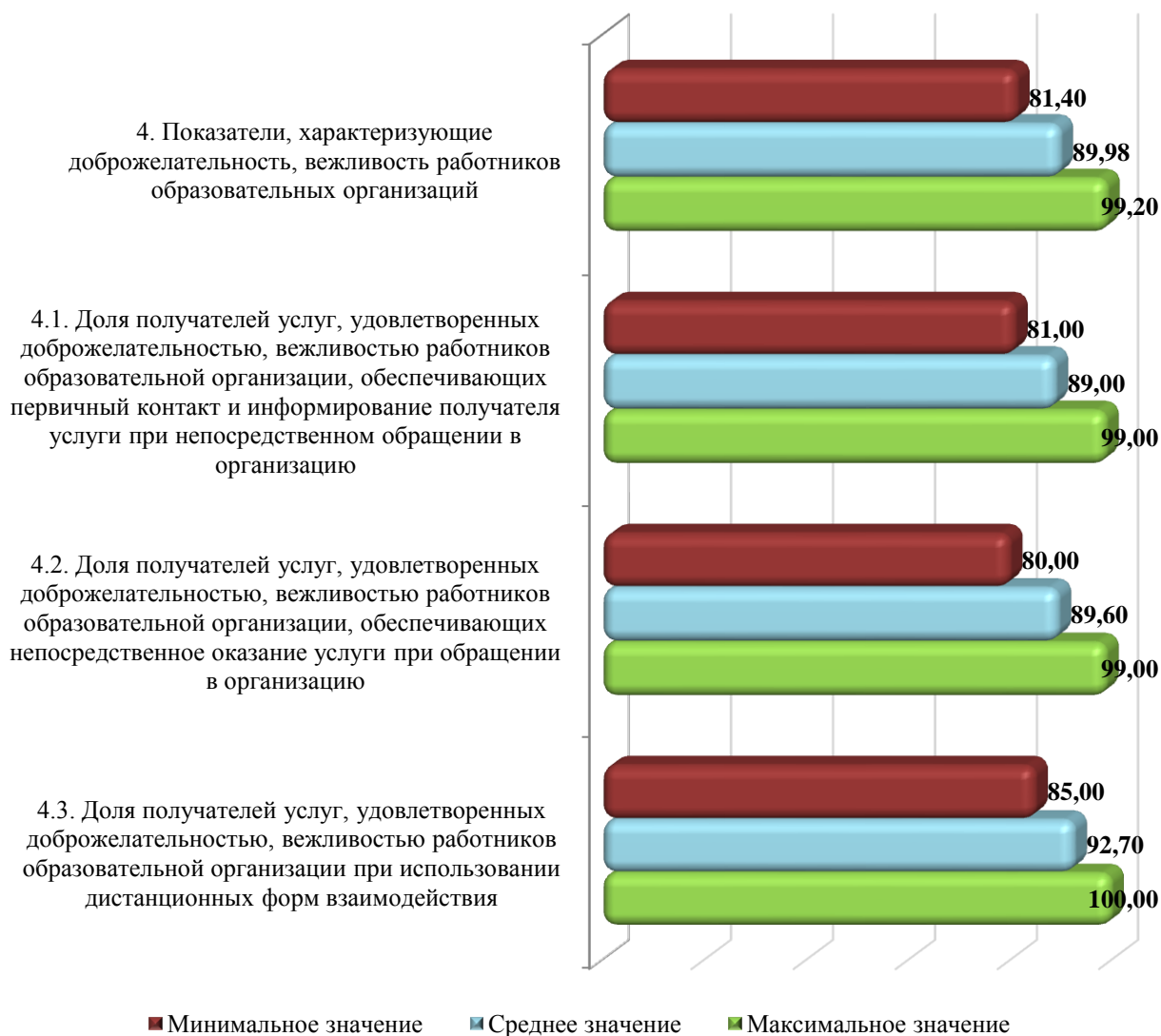
Диаграмма 4.4 – Среднее, наибольшее и наименьшее значение показателей группы «Доброжелательность, вежливость работников образовательных организаций», в баллах

МБОУ «Средняя школа № 100» (81,4 баллов). Среднее значение этого критерия составляет 89,98 баллов.