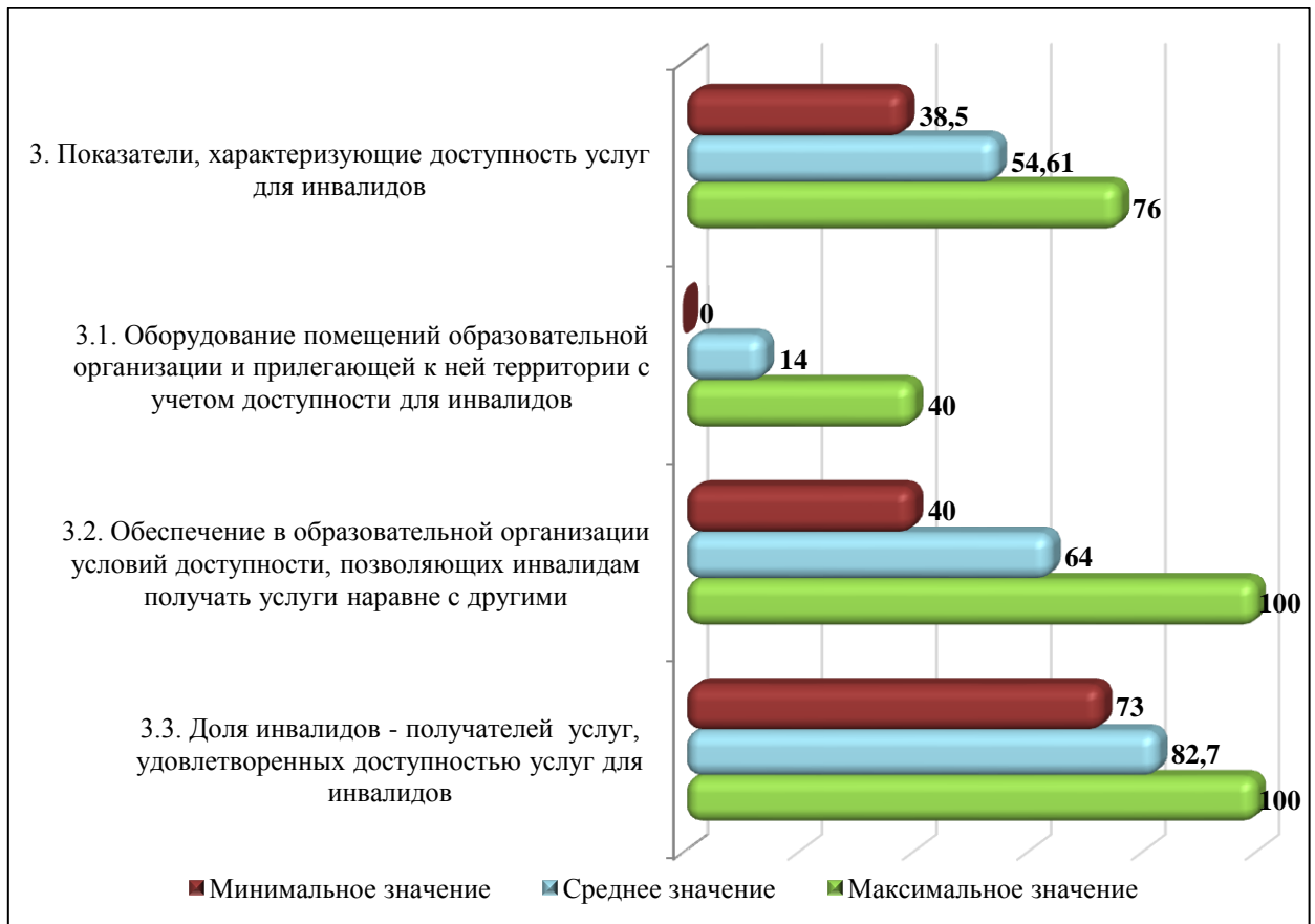
Диаграмма 4.3 – Среднее, наибольшее и наименьшее значение показателей группы «Доступность услуг для инвалидов», в баллах

По первому критерию «Оборудование помещений образовательной организации и прилегающей к ней территории с учетом доступности для инвалидов» наибольшее количество баллов присвоено МБОУ «Средняя школа № 90» (40 баллов). Не присвоены баллы 4 организациям, в которых не оборудованы помещения и прилегающие к ним территории с учетом доступности для инвалидов. Среднее значение данного показателя среди 10 обследованных учреждений составило 14 баллов.