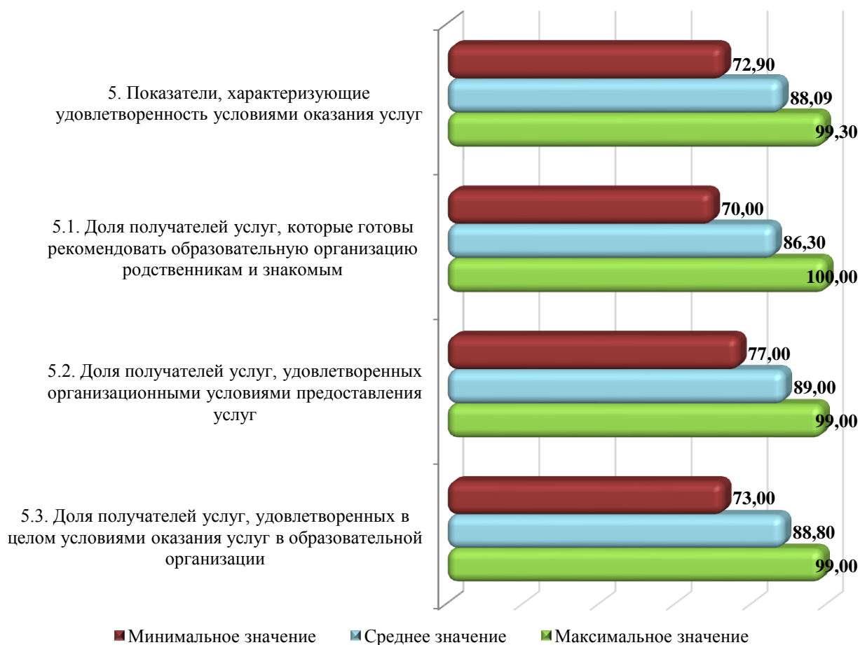
Диаграмма 4.5 – Среднее, наибольшее и наименьшее значение показателей группы «Удовлетворенность условиями оказания услуг», в баллах

О своей готовности порекомендовать организацию родственникам и знакомым заявили все респонденты в МБОУ «Средняя школа № 101 с углубленным изучением математики и информатики» (100 баллов). В меньшей степени готовы рекомендовать свое образовательное учреждение участники опроса в МБОУ «Средняя школа № 100» (70 баллов). Средний показатель по данному критерию составил 86,3 баллов.